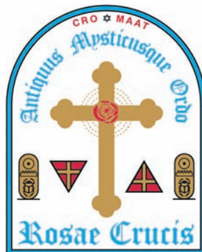
Signe officiel de l'A.M.O.R.C.